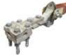
Opcional conector tipo PAT

En aleación de cobre (mínimo 80% Cu) estañados o plateados, cumplen con lo especificado en la norma UL-486A-486B, pueden ser usados con conductores de cobre o de aluminio, calibres entre No. 6 AWG hasta 556.5 MCM.